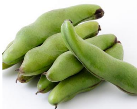
ホクホクとした甘み ソラマメ