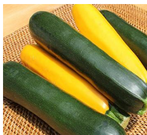
炒めて美味しい ズッキーニ