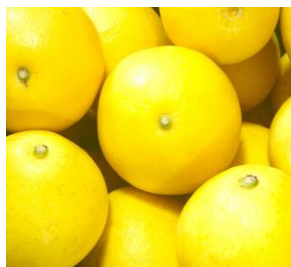
人気の ニューサマーオレンジ