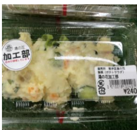
加工部のポテトサラダ