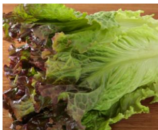
サラダで楽しむ サニーレタス