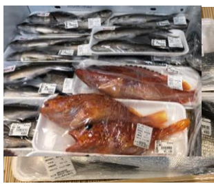
鮮魚コーナーには色々 お魚が日により並びます。 この日は『イサキ』『アカハタ』が 並びました。